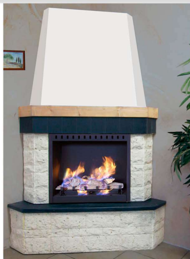
Top in ardesia